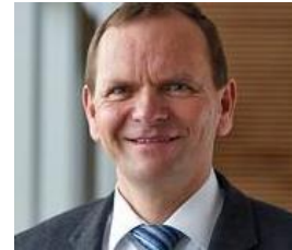
Hochschule Ostwestfalen-Lippe University of Applied Sciences